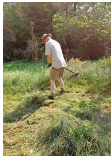
Onderhoud met de zeis

In 1995 kwam er een onderkomen voor de vrijwilligers, de Hofhut. In de zomermaanden kan hier een 'tuinwacht' logeren, die een oogje in het zeil houdt en bezoekers wegwijs kan maken.