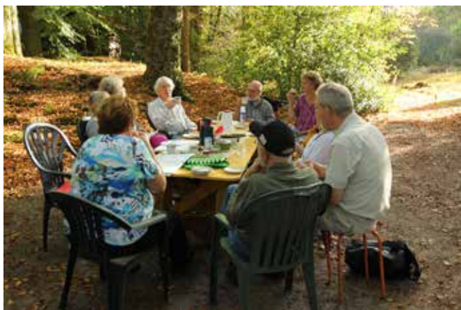
Vrijwilligers aan de lunch