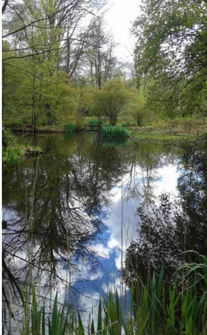
De grote vijver