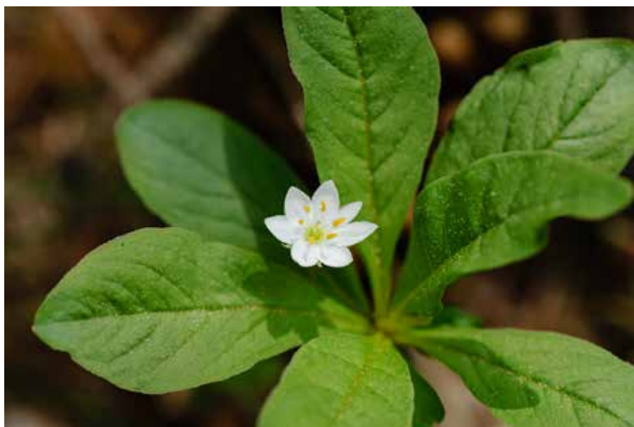
Zevenster floreert